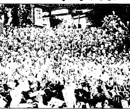
شمال البانيا محتل من قبل القوات الصربية

لندن - بلغراد - روما - بريشتينا - وكالات: تعد الدول الكبرى لرياست تحديد قوتى الى الرئيس اليوغوسلافى ميلوسيفيتش من مواصلة حملة القمع العنصرية ضد الاصلين من أصل البانوي في إقليم كوسوفو، حيث تواصل الشرطة الصربية عمليات قمع ضد مئتيه من المعتقلين.